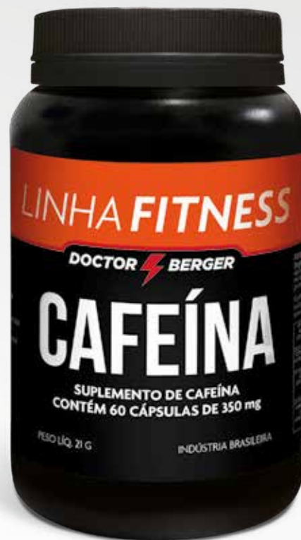
Frasco con 60 cápsulas