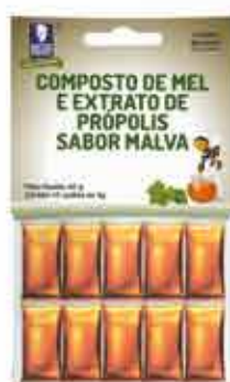
MIEL CON MALVA