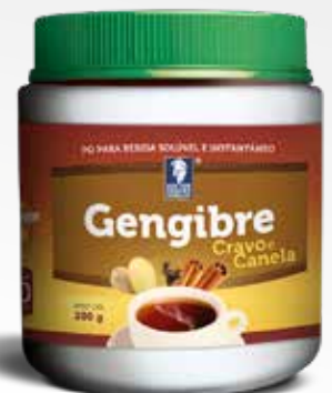
Frasco con 200 g Complemento alimenticio registrado bajo la resolución RDC 240/2018 – ANVISA BRASIL

Clavo: El clavo de la India es rico en nutrientes y aceites esenciales que ayudan a la mente y al cuerpo. Su componente principal, responsable por sus poderosos efectos y olor es una sustancia llamada eugenol, un importante anestésico local y antiséptico. El clavicordio también contiene una buena cantidad de sales minerales como el potasio, manganeso, hierro, selenio y magnesio. Además, tiene una buena cantidad de vitamina A, vitamina C, vitamina K y betacaroteno. Las propiedades del clavo aceleran el metabolismo y digestión.