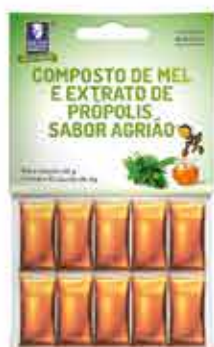
MIEL CON BERROS