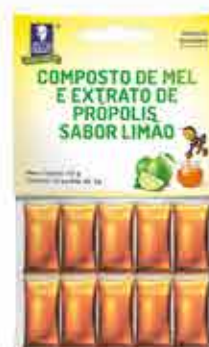
MIEL CON LIMÓN

PARA USO INTERNO. REPRODUCCIÓN Y DIVULGACIÓN PROHIBIDA