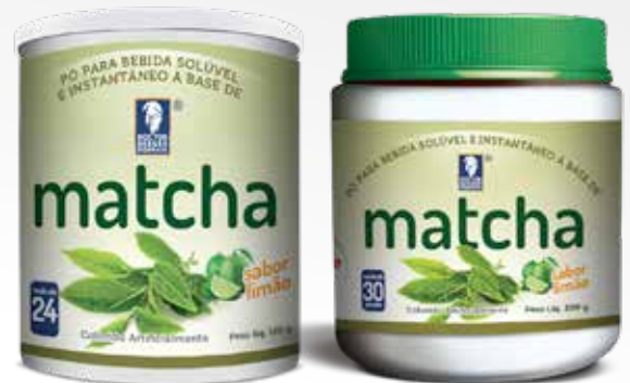
Frasco con 200 y 120 g Complemento alimenticio registrado bajo la resolución RDC 240/2018 – ANVISA BRASIL