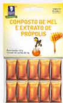
MIEL CON EXTRACTO DE PROPÓLEOS