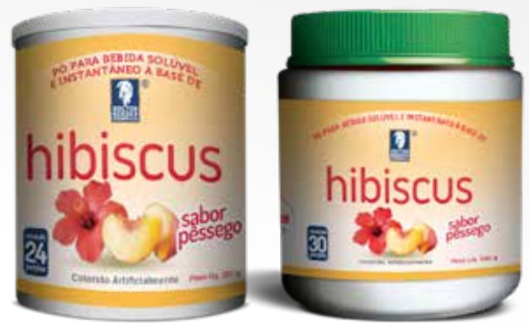
Frasco con 200 y 120 g Complemento alimenticio registrado bajo la resolución RDC 240/2018 – ANVISA BRASIL