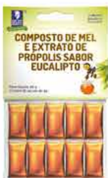
MIEL CON EUCALIPTO